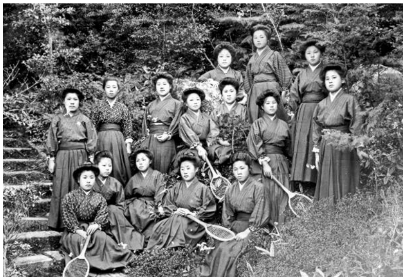
1910(明治43)年、愛知県立第二師範学校のテニス仲間と。前列右端が市川房枝、17歳

一宮市は市川房枝(1893~1981)の生誕の地です。自伝には「中島郡明地村字吉藤で生まれた。尾張の西の木曾川に沿った濃尾平野の中心地で、遙か西に伊吹山と赤石山脈が連なっていた。」とあります。教師、新聞記者を経て上京し、やがて婦人参政権獲得運動の中心的役割を果たしました。