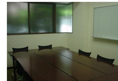
1階セミナールーム